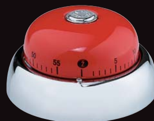
KPZ Contaminuti/Timer meccanico „Bell“, 60 minuti, rosso, cm Ø 7,2 x 4 Cod.forn. 071733 Imballo: 3/6/48 Cod.art. 511 35 63