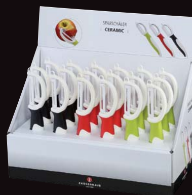
KPZ Pelaverdure „Ceramic“ in display da 18 pezzi, assortito, cm 19 x 3,5 Cod.forn. 070200 Imballo: 18/36/54 Cod.art. 511 35 24