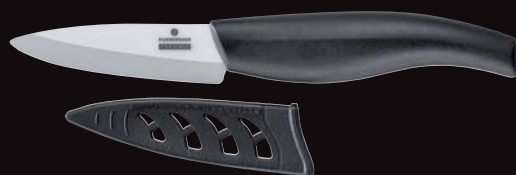
KPZ Coltello verdura „Ceraplus“ cm 7,5

coltello di alta qualità con una lama estremamente dura in ceramica zirconio. Il materiale della lama è resistente all'acidità e alla corrosione, inoltre è inodore ed insapore. Il coltello è adatto al lavaggio in lavastoviglie e idoneo per persone allergiche.