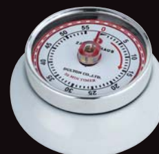
KPZ Timer "Speed" bianco con calamita, 55 minuti, cm Ø 7 x 3 Cod.forn. 072242 Imballo: 3/6/48 Cod.art. 511 21 95