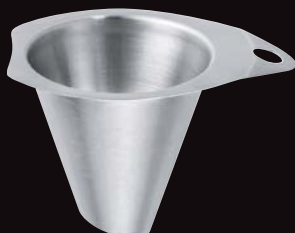
KPZ Imbuto per macina spezie Inox, cm Ø 6,5 x 5 x 4,5 Cod.forn. 036992 Imballo: 8/48/192 Cod.art. 511 32 77