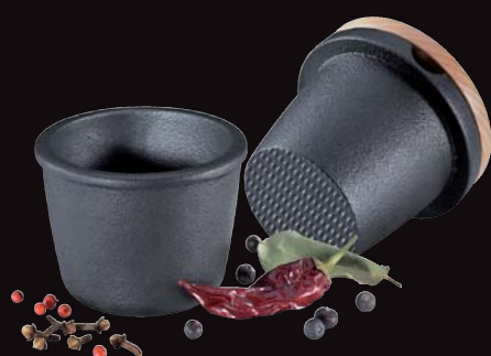
KPZ Macinaspezie nero ghisa/legno kg 1 cm 8 x 9 Cod.forn. 076080 Imballo: 1/3/6 Cod.art. 511 32 61