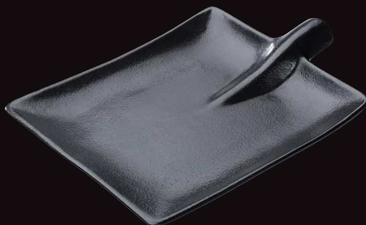
KPZ Piatto da bistecca/portata rettangolare „Worker“, ceramica, cm 25x18x4 Cod.forn. 076325 Imballo: 2/6/12 Cod.art. 511 38 69