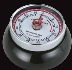
KPZ Timer "Speed" nero con calamita, 55 minuti, cm Ø 7 x 3 Cod.forn. 072310 Imballo: 3/6/48 Cod.art. 511 18 88