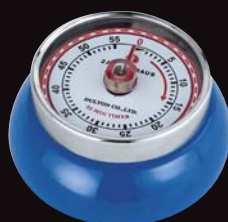
KPZ Timer "Speed" blu con calamita, 55 minuti, cm Ø 7 x 3 Cod.forn. 072273 Imballo: 3/6/48 Cod.art. 511 21 98