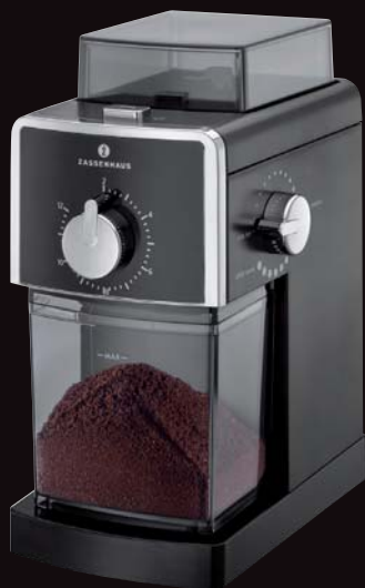
KPZ Macinacaffé elettrico „Kingston“ inox/resina, cm 23 x 10,5 x 17 Cod.forn. 043006 Imballo: 1/2/4 Cod.art. 511 32 47