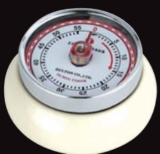
KPZ Timer "Speed" beige con calamita, 55 minuti, cm Ø 7 x 3 Cod.forn. 072334 Imballo: 3/6/48 Cod.art. 511 18 90