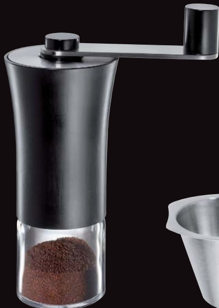
KPZ Macinacaffé „Buones Aires“ Resina/vetro, cm 16,5 x 15 Cod.forn. 041132 Imballo: 2/6/24 Cod.art. 511 32 78