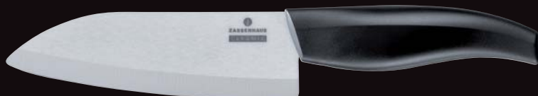
KPZ Coltello Santoku „Ceraplus“ cm 14