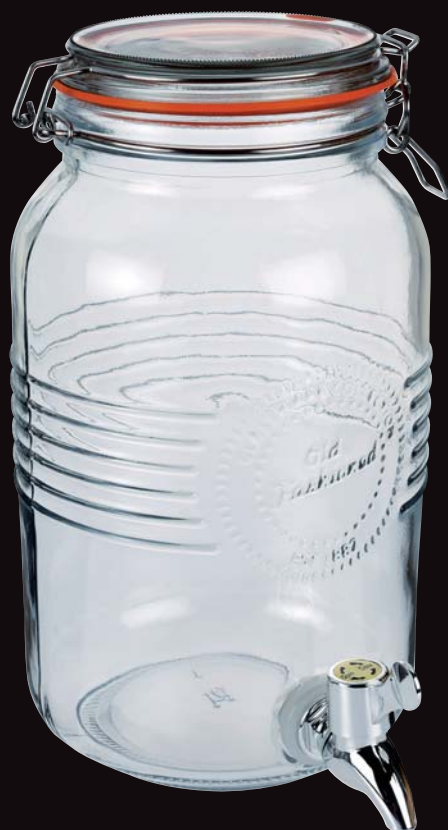
KPZ Dispenser bevande con spina „Old Fashion“, in vetro/metallo, l 3/ cm 14,5x20,5x26 Cod.forn. 047066 Imballo: 2/6 Cod.art. 511 38 41