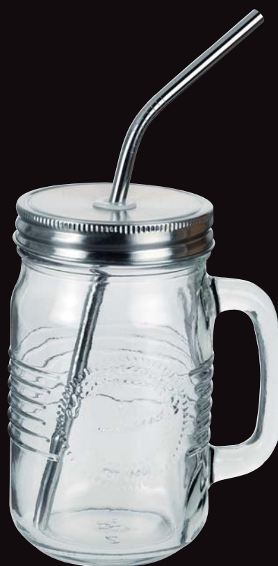
KPZ Bicchiere con coperchio e cannuccia „Old Fashion“, in vetro/inox, cl 40/cm 7,5x10,5x13 Cod.forn. 047097 Imballo: 6/12/24 Cod.art. 511 38 44