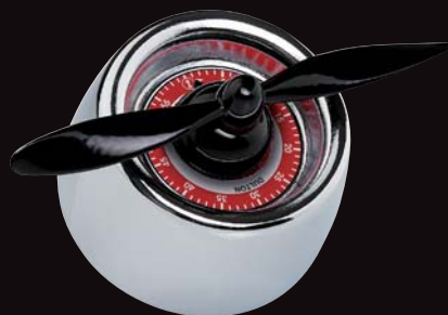
KPZ Contaminuti/Timer meccanico „Aircraft“, 60 minuti, nero cm Ø 6,5 x 5 Cod.forn. 071740 Imballo: 3/6/48 Cod.art. 511 35 64