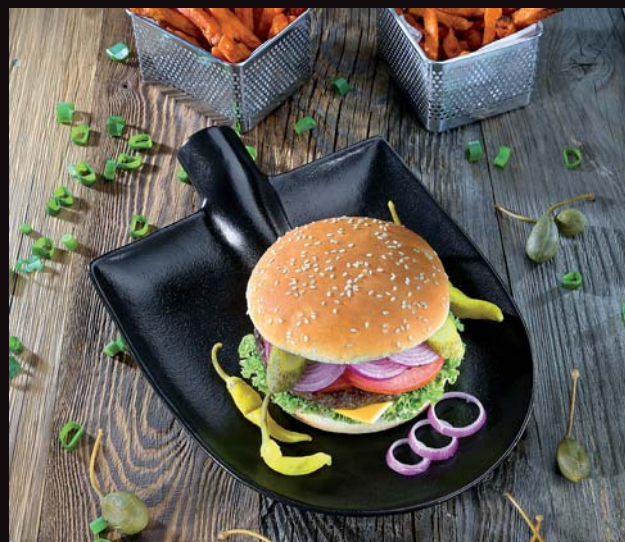
KPZ Piatto da bistecca/portata tondo „Worker“, ceramica, cm 30x22x4,5 Cod.forn. 076318 Imballo: 2/6/12 Cod.art. 511 38 68