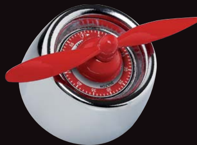
KPZ Contaminuti/Timer meccanico „Aircraft“, 60 minuti, rosso cm Ø 6,5 x 5 Cod.forn. 071757 Imballo: 3/6/48 Cod.art. 511 35 65