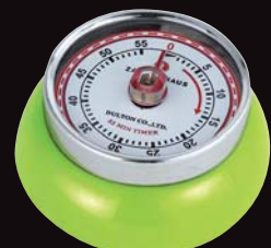
KPZ Timer "Speed" kiwi con calamita, 55 minuti, cm Ø 7 x 3 Cod.forn. 072259 Imballo: 3/6/48 Cod.art. 511 21 96