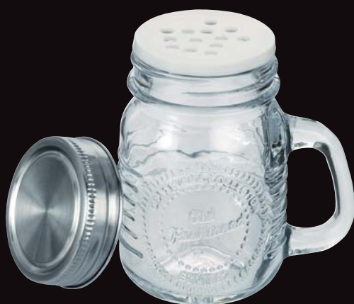
KPZ Spargispezie con manico „Old Fashion“, in vetro/inox/resina, cl 7/cm 4,9x7,8 Cod.forn. 047080 Imballo: 12/24/72 Cod.art. 511 38 43