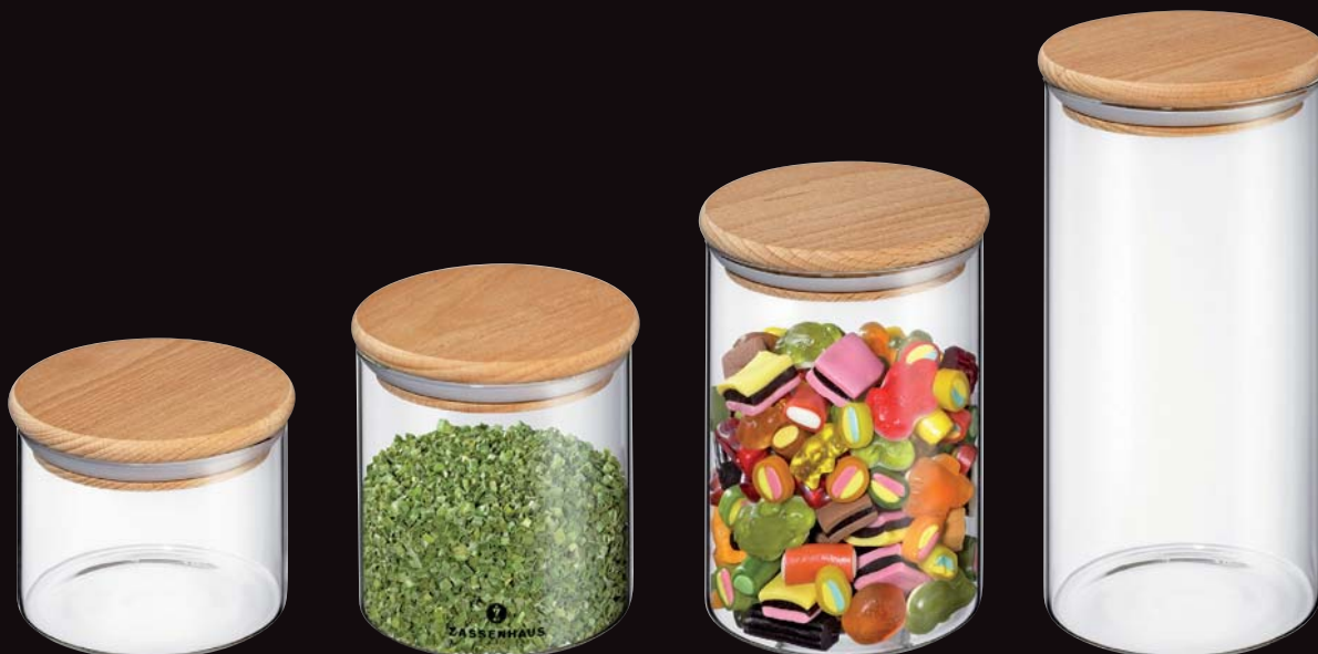
KPZ Barattolo con coperchio in faggio, tondo, in vetro borosilicato, ml 350/cmØ10,5x8 Cod.forn. 056440 Imballo: 6/12/36 Cod.art. 511 38 28

Barattolo con coperchio in faggio, tondo I barattoli da cucina non solo conservano l'aroma e la freschezza, come p. es. della pasta, del caffè o della farina, ma rispondono anche alle dinamiche della vita moderna, dove lo spazio è poco ed anche il tempo per cercare tutto quello che ci serve. Assolutamente non possono mancare in una cucina moderna e funzionale. Il contenitore in vetro borosilicato è dotato di una chiusura ermetica, grazie alla guarnizione in sililcone integrata nel coperchio.