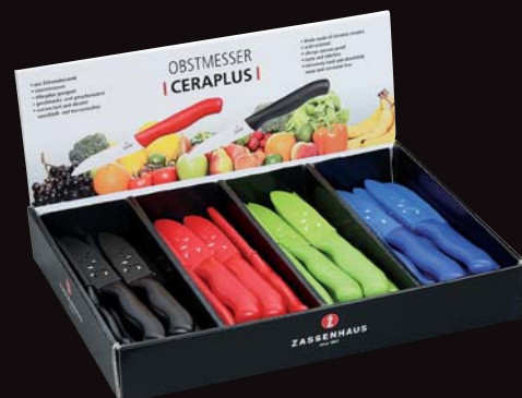
KPZ Coltello verdura „Ceraplus“ in display, colori assortiti cm 17,5 lama: cm 8 Cod.forn. 070217 Imballo: 36/72/216 Cod.art. 511 35 01