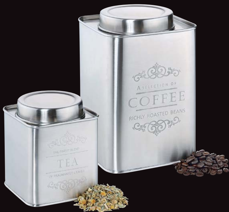
KPZ Barattolo da cucina quadrato „Coffee“, satinato in acciaio inox, kg 1/cm 15 x 15 x 21,5 Cod.forn. 067125 Imballo: 2/6/12 Cod.art. 511 38 01