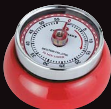
KPZ Timer "Speed" rosso con calamita, 55 minuti, cm Ø 7 x 3 Cod.forn. 072327 Imballo: 3/6/48 Cod.art. 511 18 89