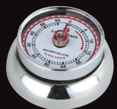
KPZ Timer „Speed“ cromato con calamita, 55 minuti, cm Ø 7 x 3 Cod.forn. 072303 Imballo: 3/6/48 Cod.art. 511 35 25