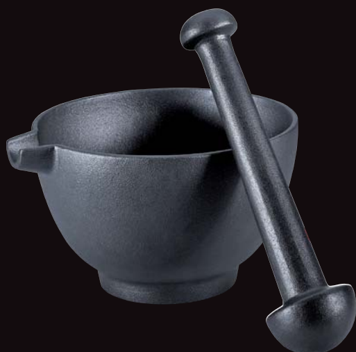
KPZ Mortaio XL nero ghisa kg 2,2 cl 75 cm 15,5 x 9,5 Cod.forn. 076066 Imballo: 1/3/6 Cod.art. 511 32 59