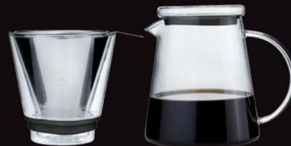
KPZ Caffetiera „Coffee Drip“ 6 tazze vetro cl 75 cm 12 x 21,5 Cod.forn. 045000 Imballo: 1/2/12 Cod.art. 511 32 68