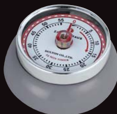
KPZ Timer "Speed" grigio con calamita, 55 minuti, cm Ø 7 x 3 Cod.forn. 071795 Imballo: 3/6/48 Cod.art. 511 35 69