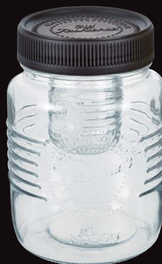
KPZ Barattolo insalata To Go con inserto separato „Old Fashion“, in vetro/resina, l 1/cm Ø10x15,5 Cod.forn. 047073 Imballo: 3/6/12 Cod.art. 511 38 42