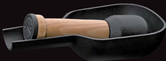
KPZ Mortaio per spezie con pestello in ghisa, cm 17,5 x 9 x 5,5 Cod.forn. 076097 Imballo: 2/6 Cod.art. 511 38 07