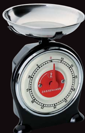
KPZ Contaminuti/Timer meccanico „Scale“, 60 minuti, nero, cm Ø 7 x 10,5 Cod.forn. 071764 Imballo: 3/6/48 Cod.art. 511 35 66