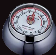
KPZ Timer „Speed“ carbone con calamita, 55 minuti, cm Ø 7 x 3 Cod.forn. 072792 Imballo: 3/6/48 Cod.art. 511 32 31