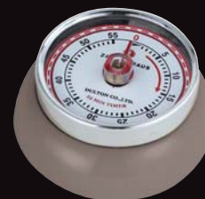
KPZ Timer "Speed" taupe con calamita, 55 minuti, cm Ø 7 x 3 Cod.forn. 071801 Imballo: 3/6/48 Cod.art. 511 35 70