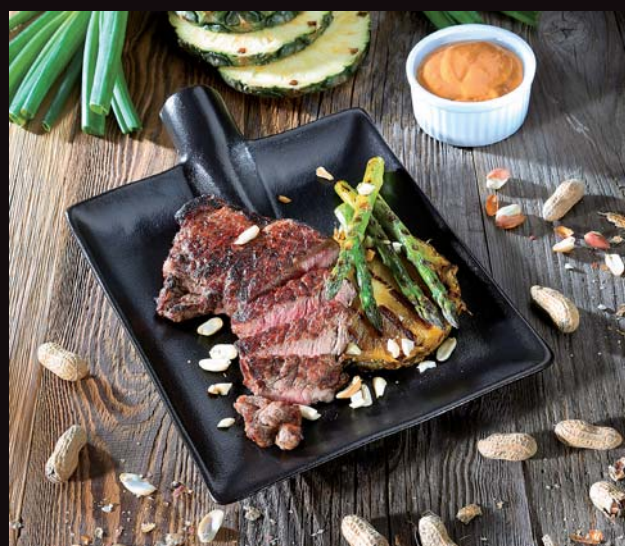
KPZ Piatto da bistecca/portata rettangolare „Worker“, ceramica, cm 30x22x4,5 Cod.forn. 076332 Imballo: 2/6/12 Cod.art. 511 38 70