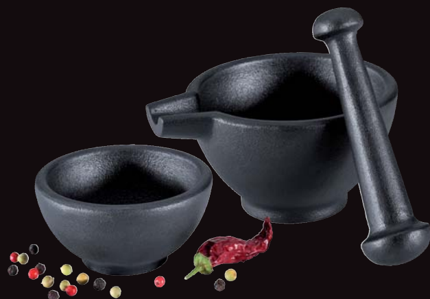
KPZ Set mortaio 3 pezzi nero ghisa kg 1,5 cm 10 x 6/8 x 4,5 Cod.forn. 076073 Imballo: 1/3/6 Cod.art. 511 32 60