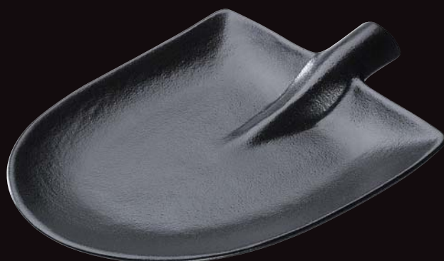
KPZ Piatto da bistecca/portata tondo „Worker“, ceramica, cm 25x18x4 Cod.forn. 076301 Imballo: 2/6/12 Cod.art. 511 38 67