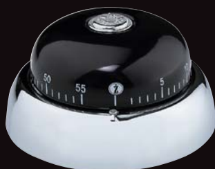
KPZ Contaminuti/Timer meccanico „Bell“, 60 minuti, nero, cm Ø 7,2 x 4 Cod.forn. 071726 Imballo: 3/6/48 Cod.art. 511 35 62