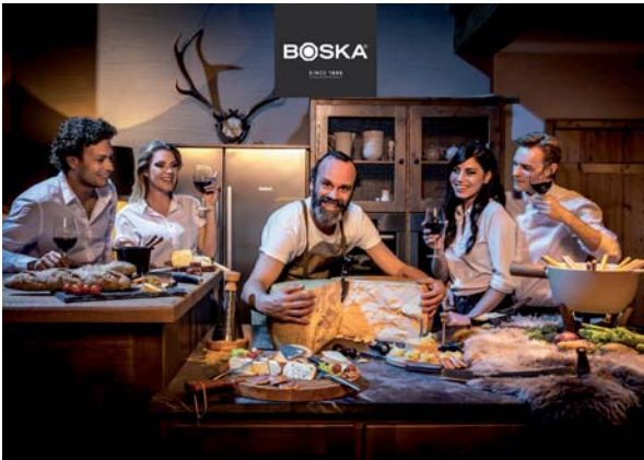
Poster vetrina grande, cm 129 x 91