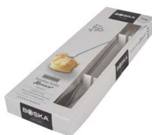
Confezione 4 forchette per fonduta al formaggio "Monaco+"