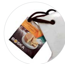
Piatto da portata rettangolare S „Marmo“

Il piatto da portata in marmo aggiunge un tocco di stile in cucina. Grazie alla lucidatura del marmo il piatto rimane igienico e non assorbe odori. Il manico ergonomico facilita il trasporto. Non adatto al lavaggio in lavastoviglie.