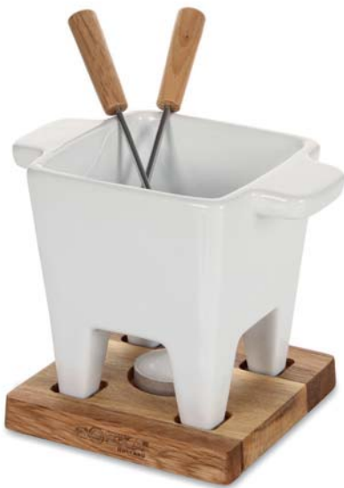
Set per fonduta al cioccolato/ formaggio „Tapas“, 4 pezzi