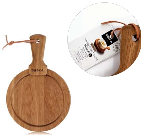
Tagliere da portata tondo S „Friends„