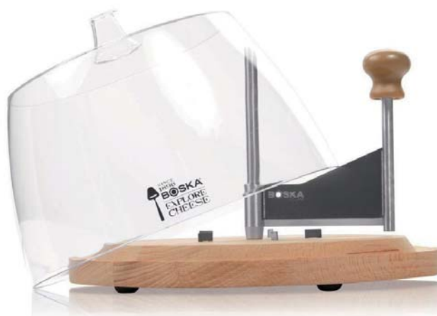
Tagliere raschia formaggio con campana „Amigo”