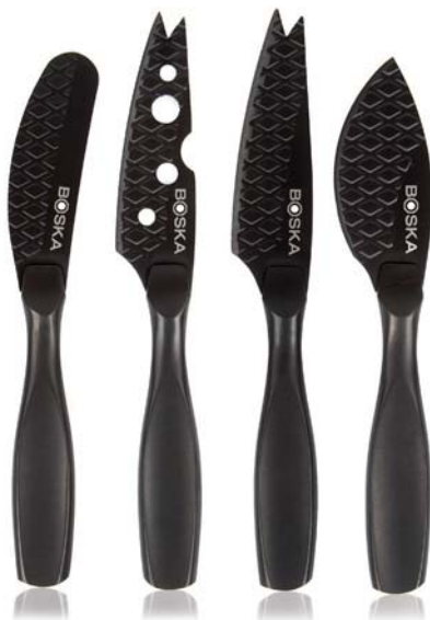
Set 4 coltelli formaggio mini „Monaco+„

Questi coltelli straordinari, con custodia in cuoio (cm 25x28), sono il regalo perfetto per ogni amante del formaggio. Grazie al rivestimento antiaderente in colore nero e la struttura ben ponderata il formaggio tagliato non resta attaccato all'utensile. Il manico piatto consente una presa sicura e maneggevole. I coltelli sono estremamente affilati, realizzati in acciaio inox e lavabili in lavastoviglie.