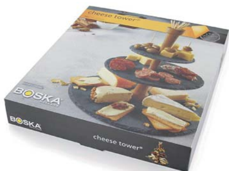
Etagere tonda a 3 piani „Party Tower,,

L'alzata con ripiani in ardesia è ottima per servire con stile. Il manico in legno quercia non è solo maneggevole, ma può anche essere utilizzato come portastecchini. I piedini antiscivolo sul fondo garantiscono una maggiore stabilità e sicurezza. Non adatto al lavaggio in lavastoviglie.