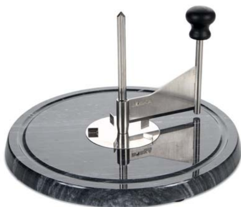
Tagliere raschia formaggio „Marmo,,