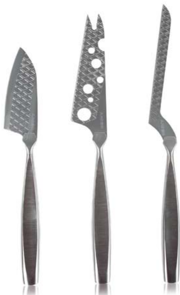
Set 3 coltelli formaggio „Monaco+”

Cod.art. 512 01 10 Cod.forn. 307095 Materiale: Acciaio inox Dimensioni: cm 21-26 Conf.: confezione regalo