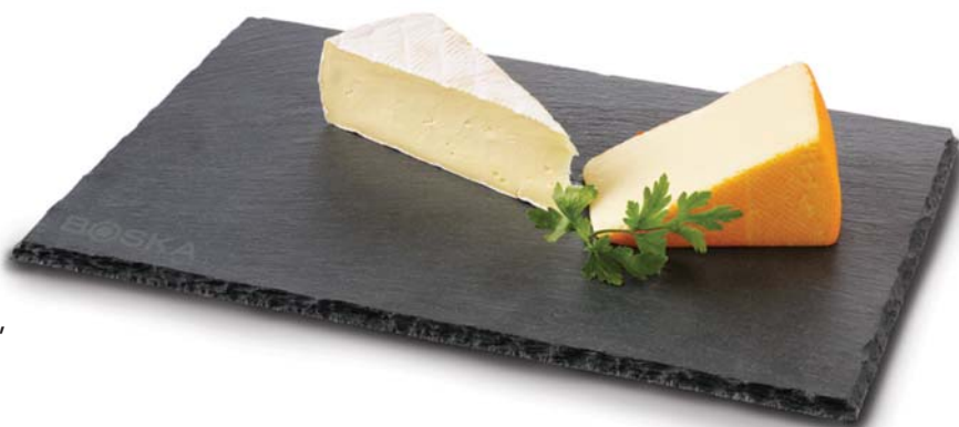
Piatto da portata rettangolare L „Ardesia,,