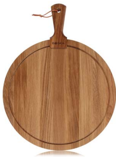
Tagliere da portata tondo L „Friends„