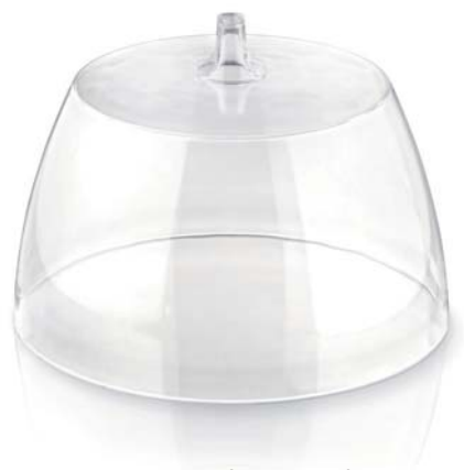
Campana per tagliere raschia formaggio

Con questo attrezzo maneggevole si creano delicatissimi riccioli di formaggio. La base in legno di faggio è dotata di 5 punte, che garantiscono l'appoggio sicuro del pezzo di formaggio. Utilizzare la campana in resina per mantenere la freschezza e gli aromi del formaggio. Può essere utilizzato anche con il cioccolato. Facile da montare e smontare, quindi occupa poco spazio in cucina. Non adatto per il lavaggio in lavastoviglie.