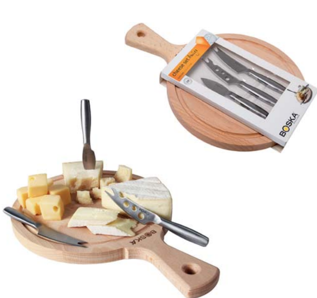
Kit formaggio „Amigo“, 4 pezzi

Questo piccolo set da fonduta, composto da 1 pentolino in gres adatto a lavastoviglie e microonde, 2 forchette in legno di quercia ed acciaio inox ed 1 base in legno di quercia, è ideale per una serata romantica in coppia. 1 lumino incluso nella confezione.