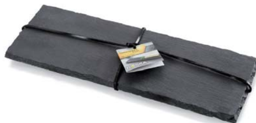
Piatto da portata rettangolare S „Ardesia,,