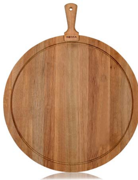
Tagliere da portata tondo XL „Friends„