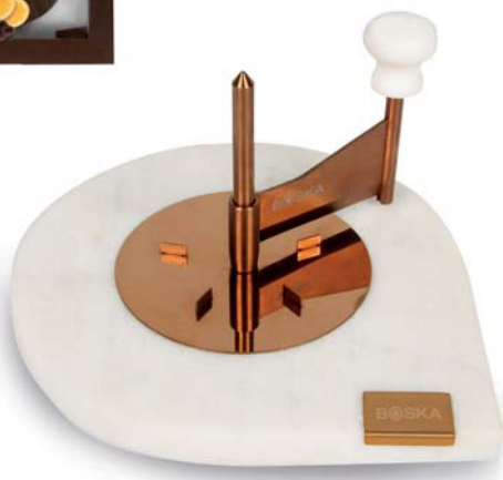
Tagliere raschia cioccolato „Marmo„

Cod.art. 512 01 38 Cod.forn. 320420 Materiale: Marmo/Acciaio inox Dimensioni: cm Ø 21,5 x 3,5 Conf.: confezione regalo