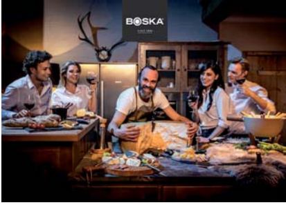
Poster vetrina piccolo, cm 91 x 65