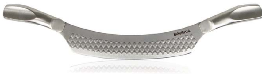
Coltello formaggio Comté „Monaco+ Nr.7”

Cod.art. 512 01 08 Cod.forn. 307093 Materiale: Acciaio inox Dimensioni: cm 29 Conf.: cartoblister