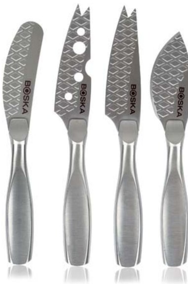
Set 4 coltelli formaggio mini „Monaco+”

Cod.art. 512 01 11 Cod.forn. 307096 Materiale: Acciaio inox Dimensioni: cm 14,5-16 Conf.: confezione regalo