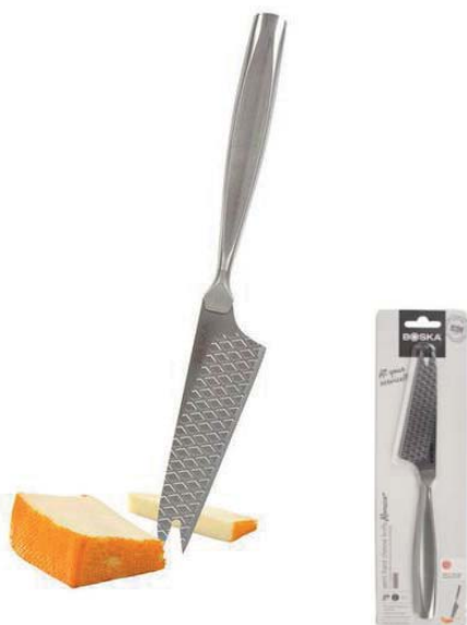
Coltello per formaggio a pasta semidura „Monaco+ Nr.5”

Cod.art. 512 01 13 Cod.forn. 307098 Materiale: Acciaio inox Dimensioni: cm 24 Conf.: cartoblister