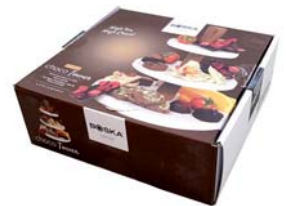
Etagere tonda a 3 piani „Choco Tower„

Cod.art. 512 01 39 Cod.forn. 320421 Materiale: Marmo/Legno quercia Dimensioni: cm Ø 18,5 x 21 Conf.: confezione regalo