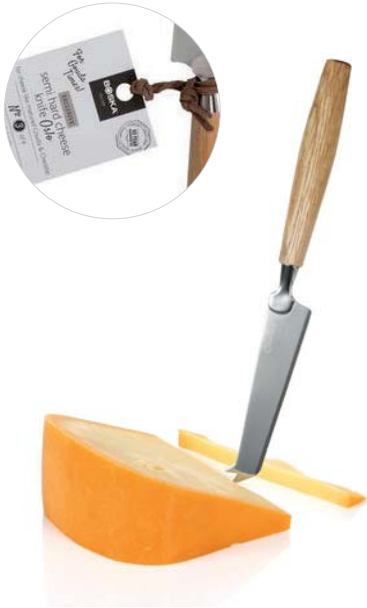
Coltello per formaggio a pasta semidura "Oslo Nr.3"