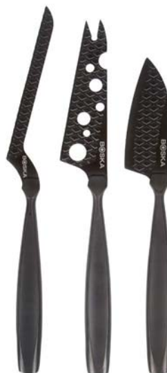
Set 3 coltelli formaggio „Monaco+„ con custodia in cuoio