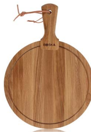
Tagliere da portata tondo M „Friends„