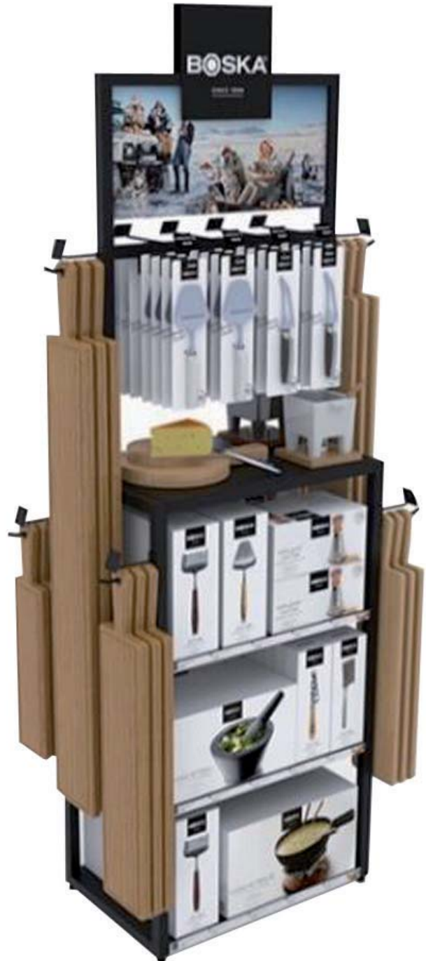
Espositore da pavimento „Quarter Pallet“ vuoto