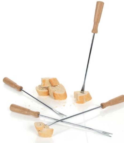
Confezione 4 forchette per fonduta al formaggio „Oslo“